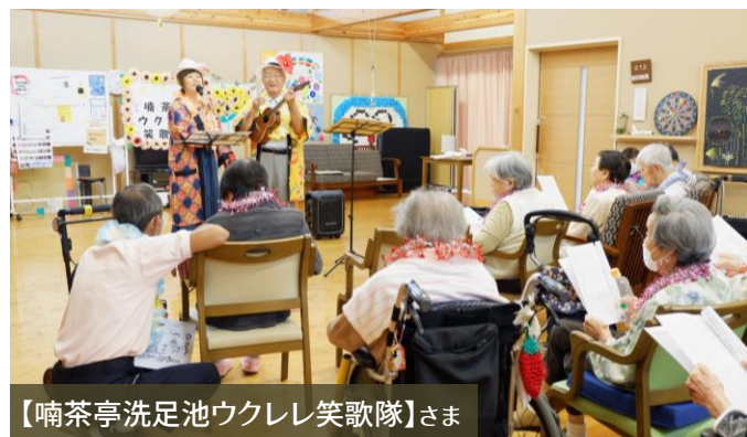
【喃茶亭洗足池ウクレレ笑歌隊】さま

三密に注意しつつ、ボランティアの方々の慰問を再開させていただいております。「喃茶亭洗足池ウクレレ笑歌隊」さまのウクレレに合わせて昭和歌謡を歌ったりクイズに答えたり。「ろごす埼玉深谷」さまは腹話術のケンちゃんに親しまれました。