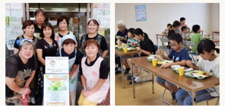
1.稲毛代表(手前左)とメンバーの皆さん。 2.感染防止に配慮した食事風景。

運営にあたっては、以前このコーナーでもご紹介したイエローハーツ様からも指導いただいたとのこと。新進気鋭のメンバーが切り盛りする食堂へ、ぜひ足をお運びください！