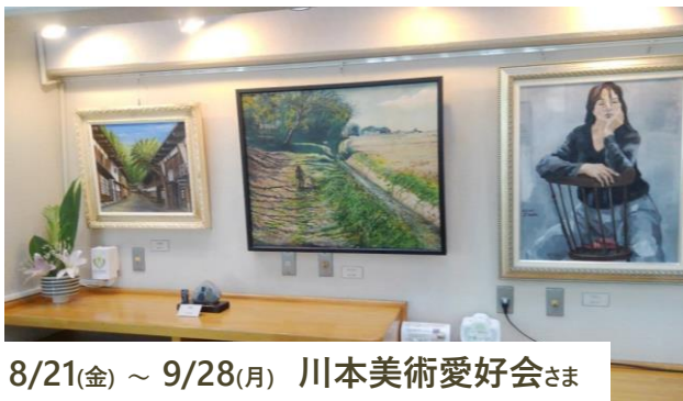
8/21(金) ~ 9/28(月) 川本美術愛好会さま