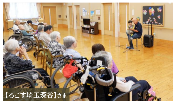
【ろごす埼玉深谷】さま