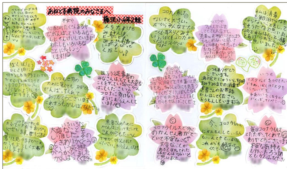
※掲載にあたり、事前に許可をいただいております。

藤沢小学校4年2組の生徒さんから、病院職員へあたたかい心のこもったメッセージをあつめた寄せ書きをいただきました!新型コロナウイルスの感染拡大が続く中、不安や悩みを抱えながら日々の業務にあたっているスタッフにとって、たくさんの応援や労いの言葉が大変ありがたく、励みになりました。当院からは、お礼に感謝状を贈呈させていただきました。藤沢小学校4年2組の皆さん、本当にありがとうございました!