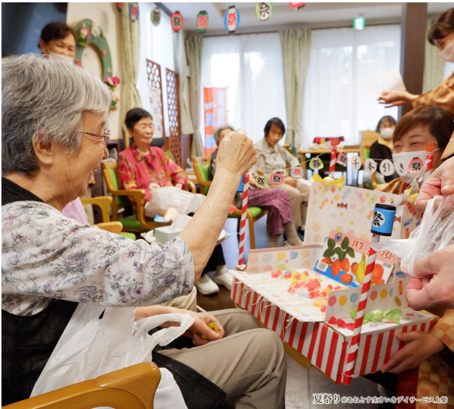
夏祭り@おねとす生きいきデイサービス上柴